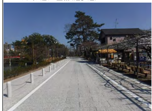
▲乙川プロムナード(乙川堤防道路)