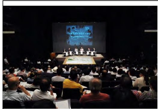
▲フォーラムの開催

※地区のまちづくりに関わった、地域住民の方のコメントを簡潔に（200～300字程度）