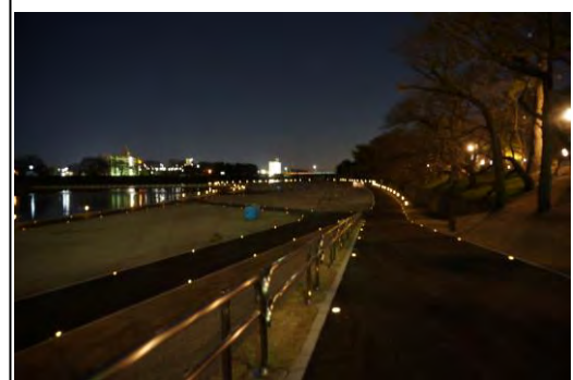
▲乙川河川敷の整備（遊歩道）