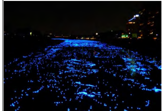
▲泰平の祈りプロジェクトの開催