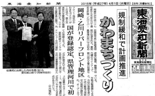
▲かわまちづくり支援制度への登録