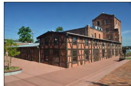
▲常時公開が可能となった半田赤レンガ建物