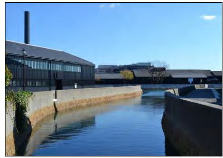
▲半田運河周辺の景観

ソフト事業のベースである「はんだ蔵のまちネットワーク」（事務局：NPO 法人半田市観光協会）の月例情報交換会への参加者は、平成 20 年 10 月の発足当時の 2 倍以上になり、半田運河周辺の賑わい創出のため、活発な情報交換が行われています。