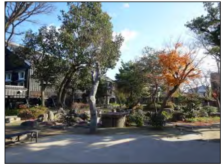
▲半田運河の観光拠点となる半六庭園