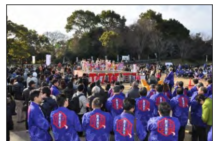
▲新美南吉生誕 100 年記念事業 開幕祭