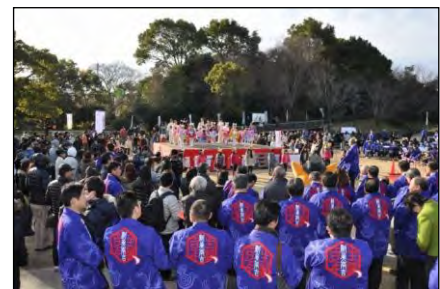
▲新美南吉生誕 100 年記念事業 開幕祭