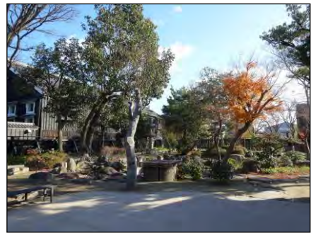
▲半田運河の観光拠点となる半六庭園