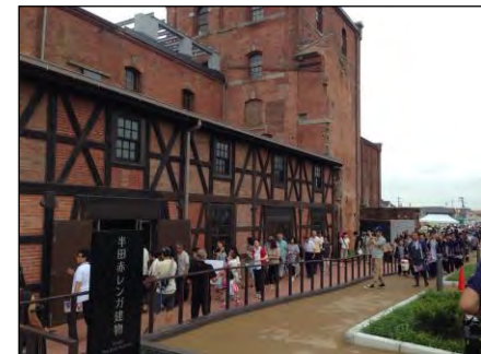
▲再整備オープン時の様子