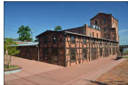
▲常時公開が可能となった半田赤レンガ建物