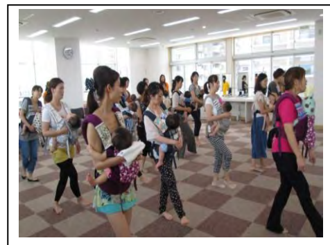
写真2 あまが池プラザの催し 【ベビーダンス】