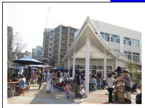
写真1 あまが池プラザ

本市では、JR守山駅周辺の中心市街地の活性化と都市再生整備計画をうまく連携させることにより、当初掲げた目標を大きく上回る成果が得られました。その一つの理由は情報共有です。商工会議所、まちづくり会社みらいもりやま 21、市のトップが定期的に集まり、事業の進捗、イベント開催、施設利用者の状況等を確認することにより、関係者の意思疎通を図っています。「計画の作成がゴールとなり、あとは全て担当者任せ」という団体がありますが、本市では「トップと現場職員が常に意識を共有し、課題解決のときにはしっかり寄り添って一緒に行動し、解決する。」という姿勢で取り組んでいます。今後もより一層関係者と情報を共有し、活力ある「住みやすさ日本一のまち」を目指していきます。