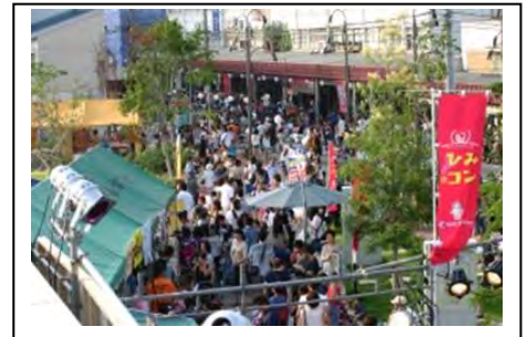
写真 5 守山夏祭り（銀座商店街前）

私は中心市街地にある守山銀座ビル協同組合の店舗付き住宅で商売と生活をしています。市の中心市街地活性化計画の施行以降、商店街に隣接した幼稚園・小学校の合築事業に伴い、子育て世代が商店街を歩き来し、子どもたちの活気が表立つようになりました。もともと地元自治会などの地域活動が活発なところに「あまが池交流プラザ」と「あまが池親水緑地」が整備されたことにより、今までにも増して幅広い世代が繋がりを持てる場が増えました。また、商業者にとってもまちづくり会社みらいもりやま 21 の企画する商店街活性化「三種の神器（100 円商店街、バル、まちゼミ）」事業により停滞していた商店街にも少しずつ賑わいが戻りつつあります。そうした環境に甘えることなく商店主も今以上に努力をしていかなければならないと思います。