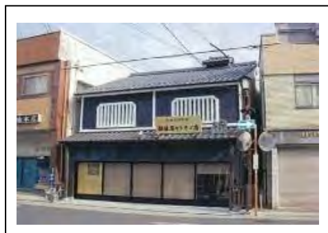
写真3 中山道の街並み整備