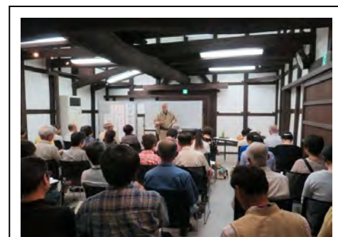
写真4 うの家の催し