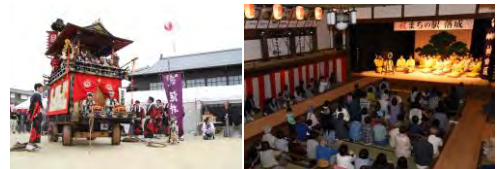
▲まちの駅オープニングイベントの様子