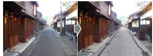
▲市道柳町線（三丁町）整備イメージ