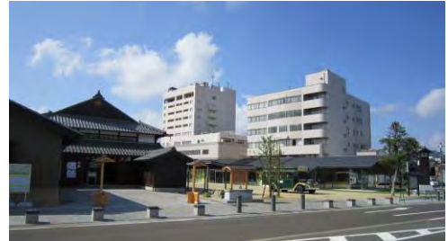
▲全国で 30 ほど、県内唯一の現存する芝居小屋「旭座」を移築した「まちの駅」