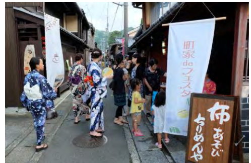
▲町並みを活かした縁日イベント 「町家 de フェスタ」