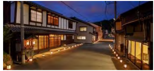
▲小浜西組重要伝統的建造物群保存地区

小浜西組が平成 20 年に重要伝統的建造物群保存地区に選定され、家屋の修理・修景も進んできました。電線地中化を始めとした整備により、縁日イベント「町家 de フェスタ」や、「町家 de 祝言」などのイベントがますます町の風情に似合ってくるのではと期待しています。今後もこうしたイベントなどを通じて、小浜西組の良さを多くの方に知っていただけるよう、頑張っけてゆくつもりです。