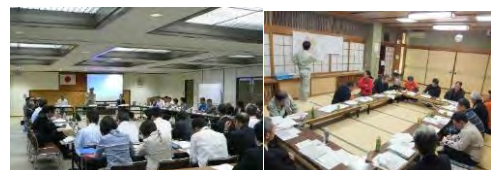
▲観光まちづくり計画策定に向けた会議 および地域住民とのワーキングの様子