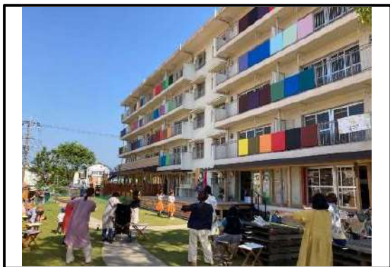
朝の定例となっているフラダンス 終了後、カフェで朝食をとる方も多い