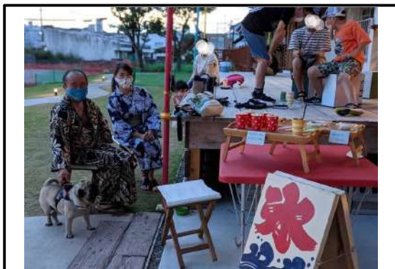
夏祭りの様子 クラフトビールやかき氷を片手に夕涼み