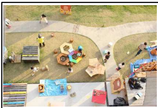
DIY工房で作成した オリジナルの遊具で遊ぶ子どもたち