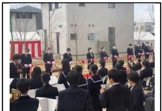
住宅エリアのまちびらき式典の様子 地元の中学生在が吹奏楽の演奏をおこなった