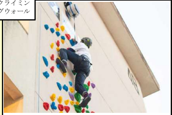
クライミング グウォール