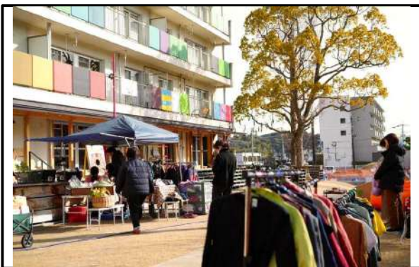
地域の方々の持ち寄りで開催するガレージセール 衣類の他、新鮮な野菜や手作り雑貨も出品される