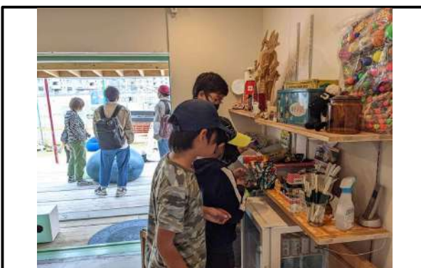
カフェでは子どもたちが手に取りやすい 駄菓子を販売している